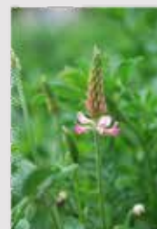
Váží dusík ze vzduchu